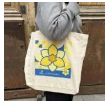
Tote Bag (10€)

Vous pouvez aussi réaliser un don directement aux stands des 2PGATL ou par internet en suivant le lien