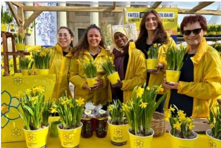
Pot de jonquille (4€)

Merci de participer à l'opération en venant aux stands ou au gymnase pour le parcours sportif