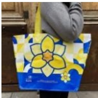
Cabas (8 €)